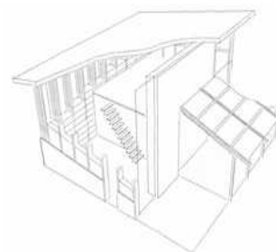
maison contemporaine (dimensions : 182xL83xH68)

Tout ou partie(s) de cette exposition peut faire l'objet d'un prêt.