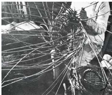
Exposition de l'association « les amis de l'osier »

L'exposition est composée de 18 encadrements (photos couleur et noir et blanc), format 30x40