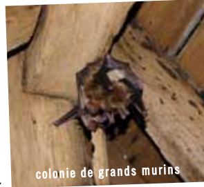
colonie de grands murins

Aménagements de combles, isolation, rejointoiements, lutte contre les pigeons... Les combles de nos édifices deviennent de plus en plus inaccessibles aux chauves-souris. Pourtant elles sont de précieux auxiliaires : on estime à 300 moustiques par nuit la consommation d'une pipistrelle commune, l'une de nos plus petites espèces. La cohabitation avec ces animaux est le plus souvent possible grâce à des aménagements légers. Il y a quelques années, la commune des Moutiers-Hubert, dans le Pays d'Auge, a procédé à l'isolation des combles de la mairie, privant ainsi une colonie de grands murins de son site de reproduction. Sensibilisée par le Conservatoire Fédératif des Espaces Naturels (CFEN), la nouvelle équipe municipale a accepté de réaliser une ouverture dans une porte permettant à nouveau l'accès des chauves-souris aux combles. Cette ouverture a été dimensionnée de manière à éviter l'intrusion d'autres hôtes comme les pigeons. A Burcy (près de Vire), une bâche a été posée sur le plancher des combles de l'église par le Groupe Mammalogique Normand (GMN). Le plancher est ainsi protégé et l'on dispose gratuitement d'un engrais biologique pour les plantations. Le Parc prépare l'édition d'une brochure de conseils pratiques pour inciter à l'accueil des chauves-souris dans les bâtiments.