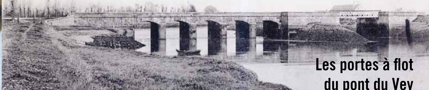
Les portes à flot du pont du Vey