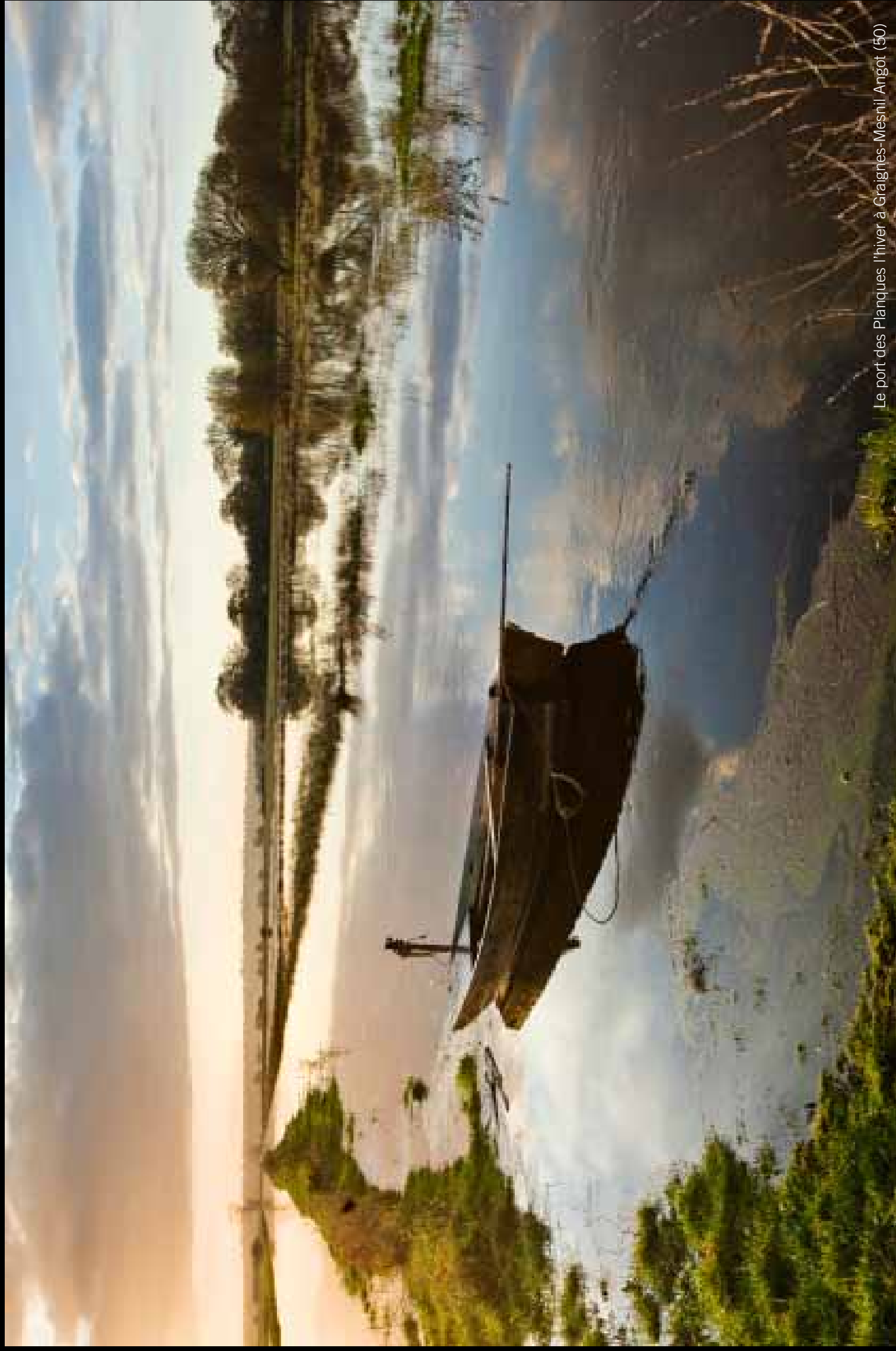
Le port des Planques l'hiver à Graignes-Mesnil-Angot (50)