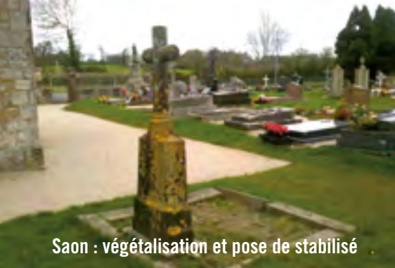
Saon : végétalisation et pose de stabilisé