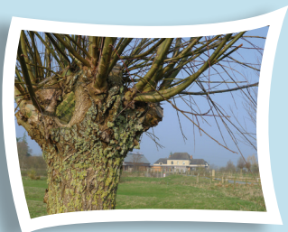
> Le saule têtard, un arbre identitaire et précieux de notre territoire