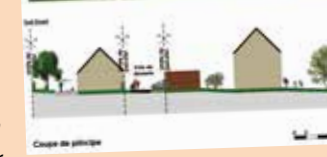
Hypothèse d'implantation du bâti

Oui, si on veut. Nous avons gardé certaines haies qui restent du domaine public, les eaux pluviales sont gérées par des noues et un verger a été planté. Mais le plus important, est que ce soit un lieu accessible au plus grand nombre et agréable à vivre, avec un lien au centre-bourg et les commerces par un cheminement doux, paysager et ludique.