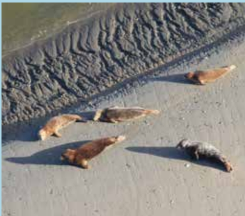
Phoques gris ( Halichoerus grypus ) en baie des Vey's