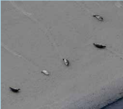
Groupe de phoques veaux-marins ( Phoca vitulina ) en baie des Vey's