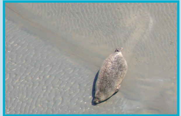
Phoque veau-marin ( Phoca vitulina ), femelle gestante en baie des Veys