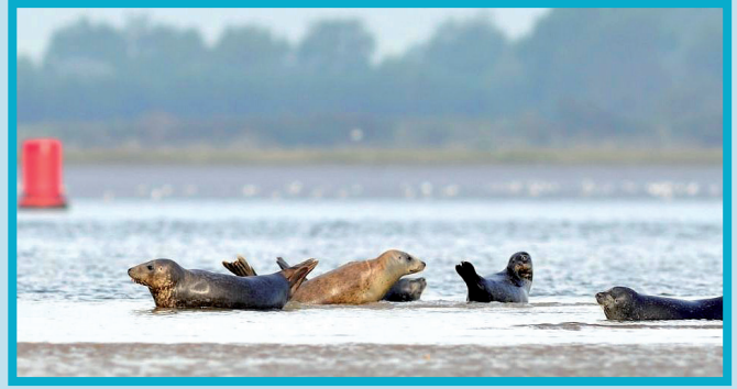
Phoques gris ( Halichoerus grypus ) en baie des Veys.

Localisation des phoques (veau-marin en jaune ; gris et veau-marin en rose) à marée basse en Baie des Veys le 6 juillet 2016. Les limites maritimes de la Réserve naturelle sont figurées en rouge.