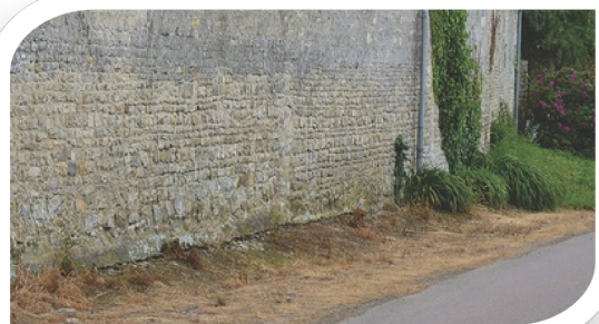
> Traitement aux herbicides à proscrire

Heureusement rare, le traitement complet aux herbicides du fossé et du talus est à proscrire. La terre est laissée à nu et facilite ainsi une colonisation des plantes dites "indésirables". Il faut alors finalement "ré-appliquer" le traitement en boucle. L'érosion sera aussi accélérée et les herbicides rejoindront les milieux aquatiques et les nappes phréatiques.