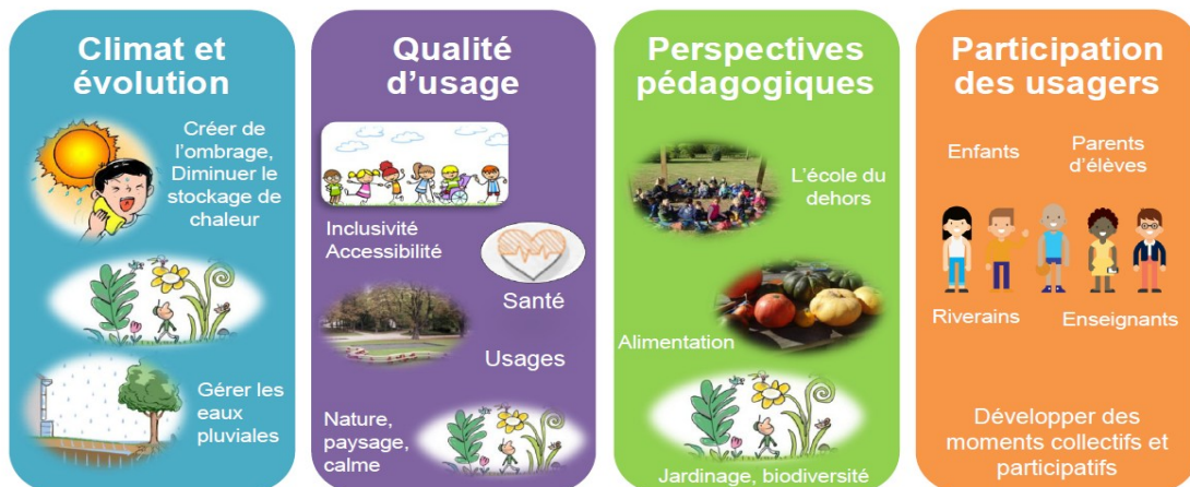
fig.in.présentation du CEREMA aux assises de la Biodiversité