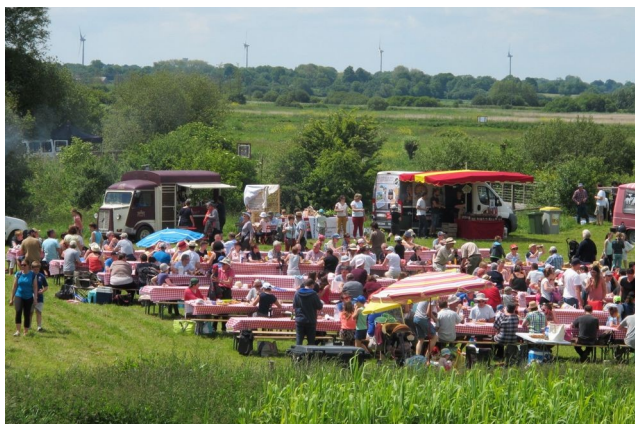
Pique-Nique à la Maison du Parc

Venir déjeuner sur le site avec son panier pique-nique ou profiter de la présence de producteurs locaux et foodtrucks pour réaliser son repas fait parti du plaisir central de cette journée.