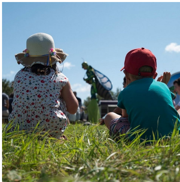
Dame nature © Astrid Chardon

La convivialité sera le maître mot de cette journée.