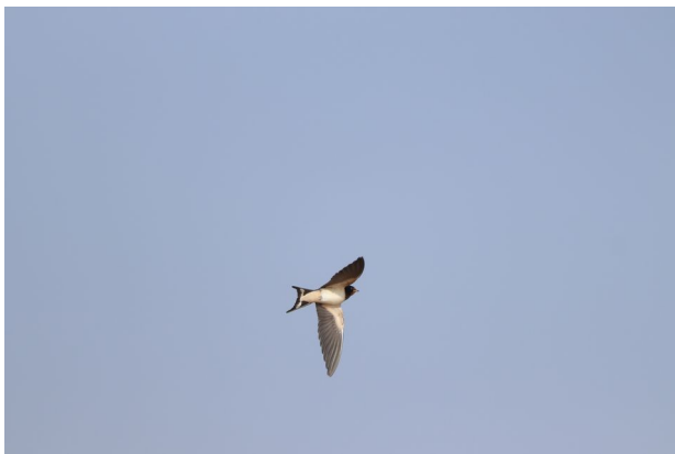
Hirondelle de fenêtre

Depuis 2011, le Parc naturel régional lance une enquête d'observation. Elle a pour objectif de déceler si le changement climatique a un effet sur le comportement migratoire des hirondelles et des martinets.