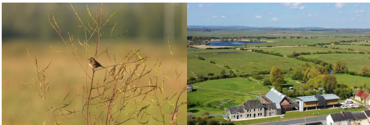
La gorgebleue à miroir, une des « stars » de ce début de printemps dans les marais du Cotentin et du Bessin.

Pendant ces vacances de printemps, la Maison du Parc est la porte d'entrée idéale pour partir à la découverte de l'ambiance des « Marais verts » dans le Parc naturel régional des Marais du Cotentin et du Bessin. Le programme « Les Rendez-vous du Parc » de printemps proposent de multiples occasions de s'immerger dans cette ambiance sonore et visuelle du printemps dans ce territoire de marais et de bocage.