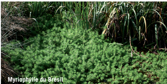
Myriophylle du Brésil

Contact : 02 31 96 77 56 - www.cbnbrest.fr Liste des plantes invasives de Basse-Normandie : www.cbnbrest.fr/site/pdf/invasives_bn.pdf .