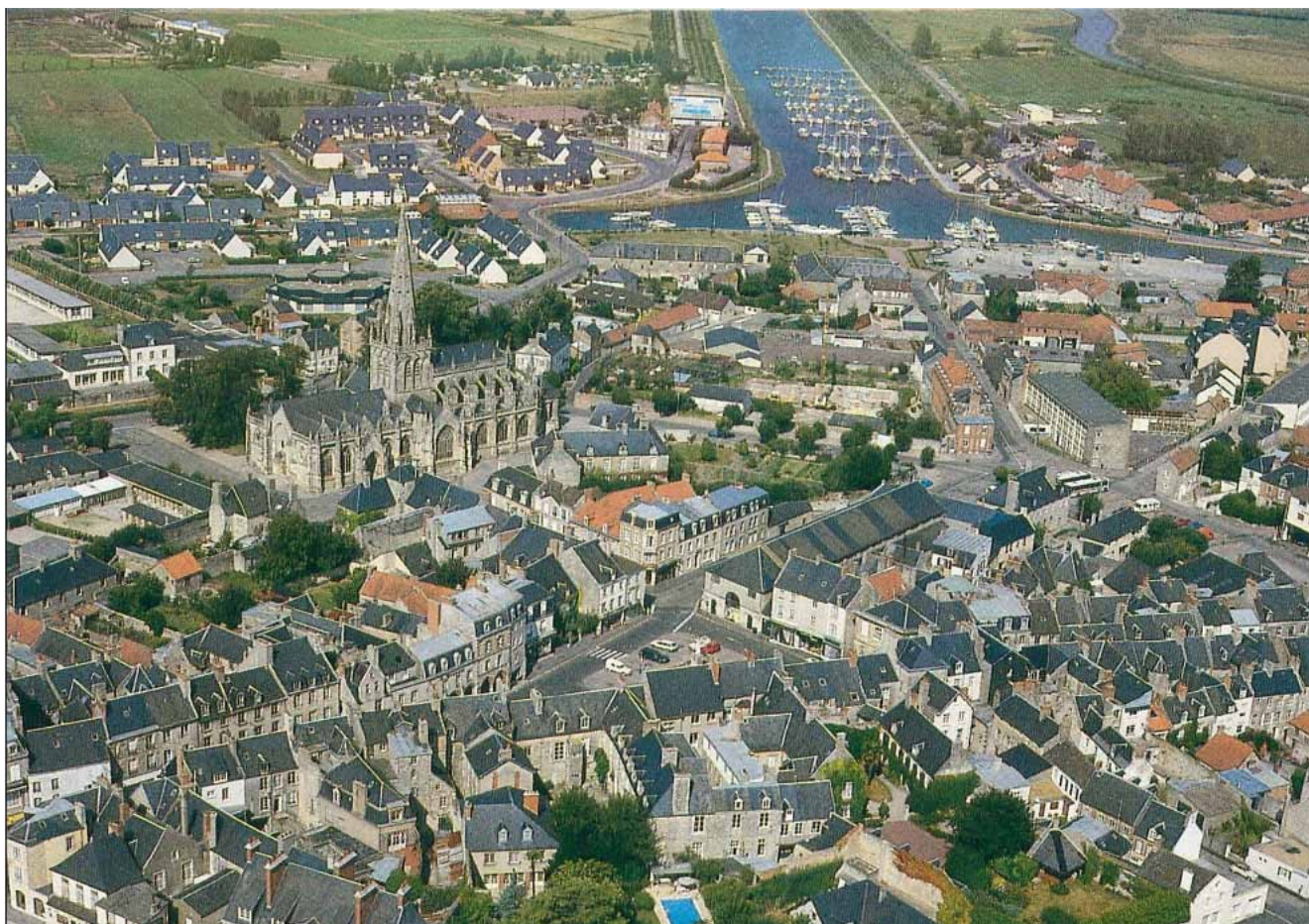
Vue aérienne de Carentan (l'église et le port de plaisance à l'horizon)

Pourtant, en 2020, la commune comptait 10 227 habitants, en augmentation de 50,77 % par rapport à 2014 puisque maintenant Carentan regroupe 12 communes déléguées. Carentan fait partie de la commune nouvelle de Carentan les Marais depuis le 1 er janvier 2016.