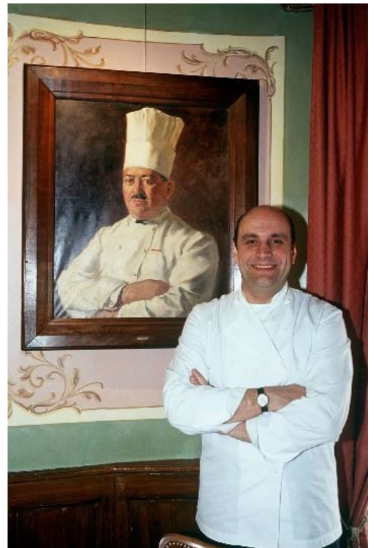
Bernard Loiseau devant le portrait d'Alexandre Dumaine