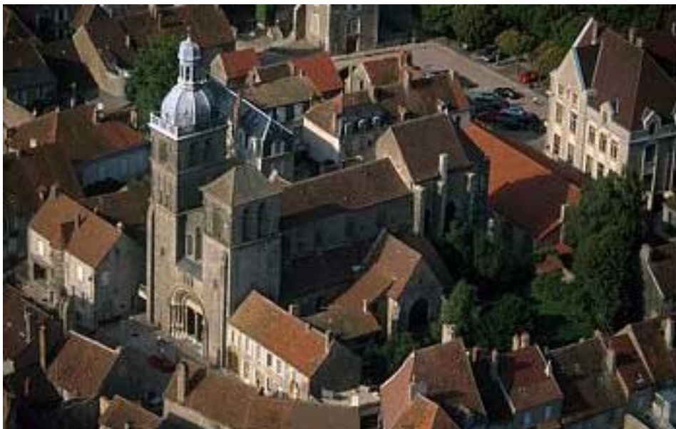
Une vue aérienne de la basilique Saint-Andoche

Les événements de Saulieu : Il y a le marché du samedi matin, la Fête de la route nationale 6 et les boucles morvandelles.