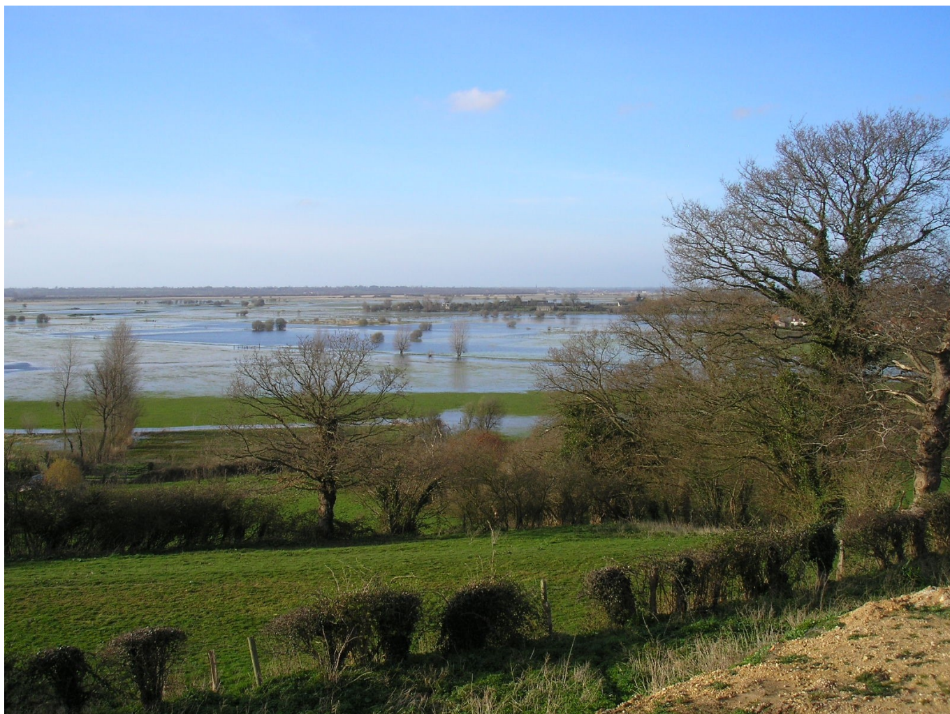
Le marais en hiver (« marais blanc ») à Graignes

L'industrie agroalimentaire (transformation de produits agricoles en produits alimentaires) est très présente (transformation du lait, fabrication de caramels, fabrication de surimi et de plats cuisinés, etc.). D'autres activités industrielles sont implantées à Carentan, comme l'entreprise Aurys fabrique des grands plateaux de miroir, qu'elle revend à des distributeurs de verre.