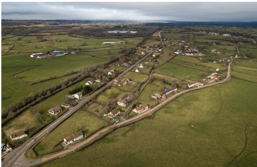
Une vue aérienne de Liernais